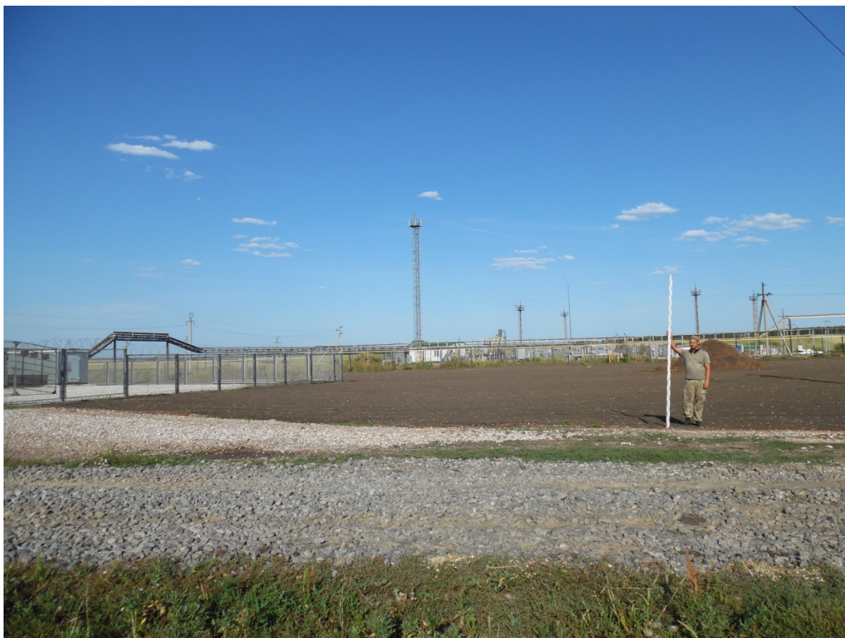
Рис. 3. Вид на участок с 3.